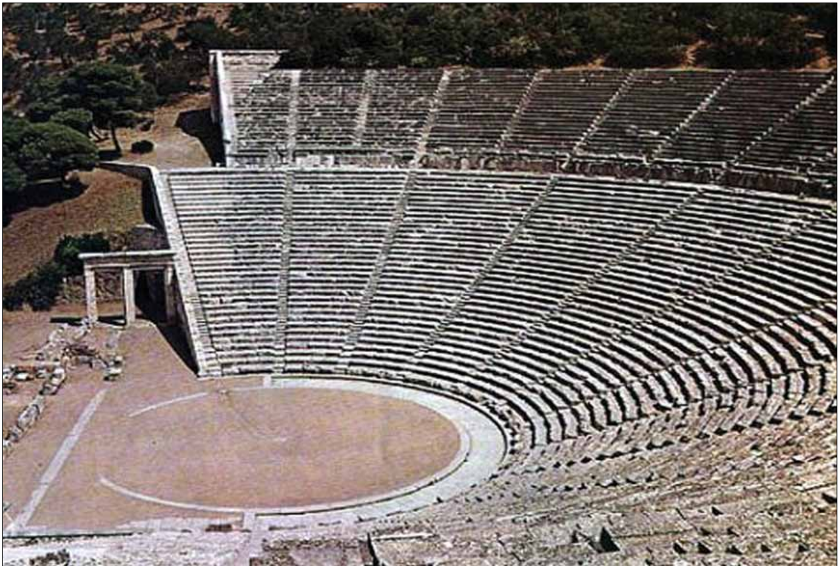
§ Επίδαυρος, 1988 (κριτήρια I,II,III,V,VI)