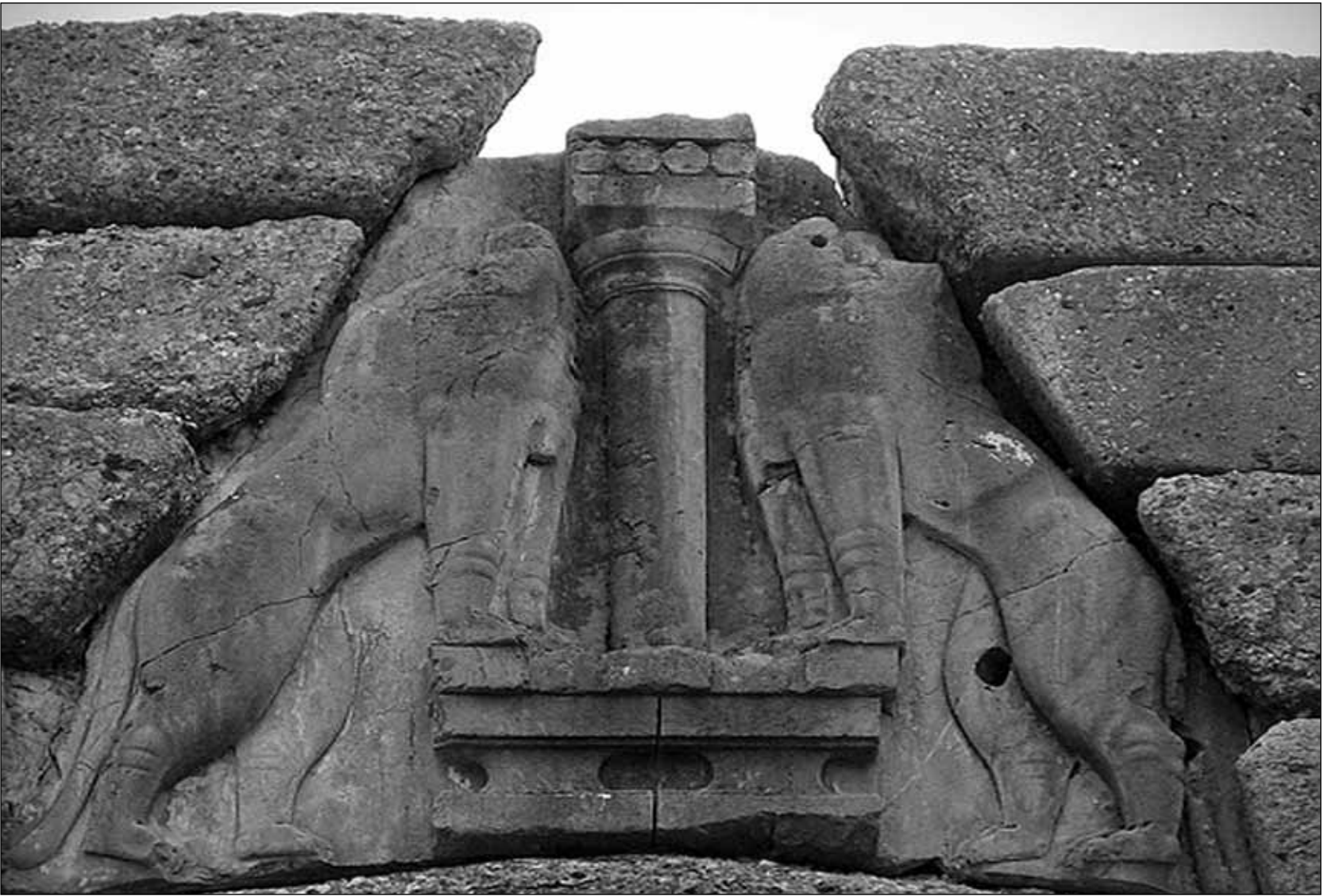
§ Μυκήνες, 1999 (κριτήρια I,II,III,IV,VI)