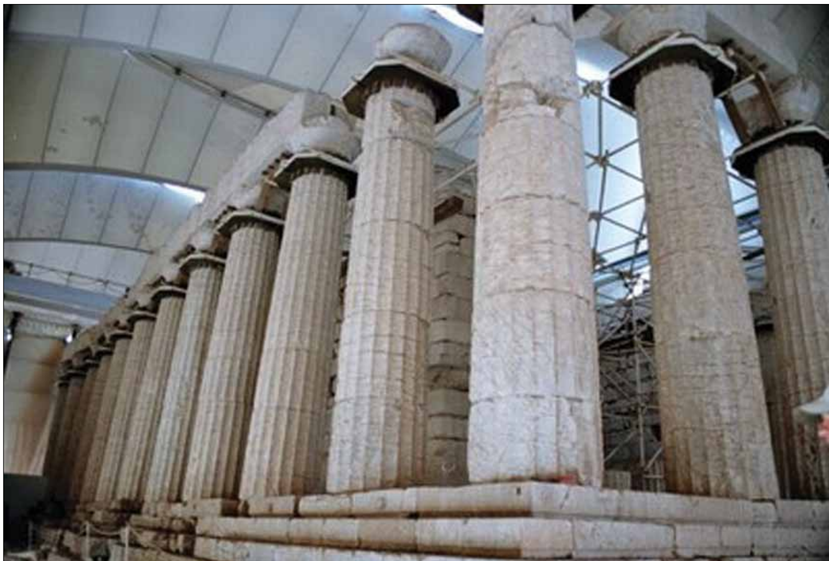
§ Ναός Επικούρειου Απόλλωνα, 1986 (κριτήρια Ι,ΙΙ,ΙΙΙ)