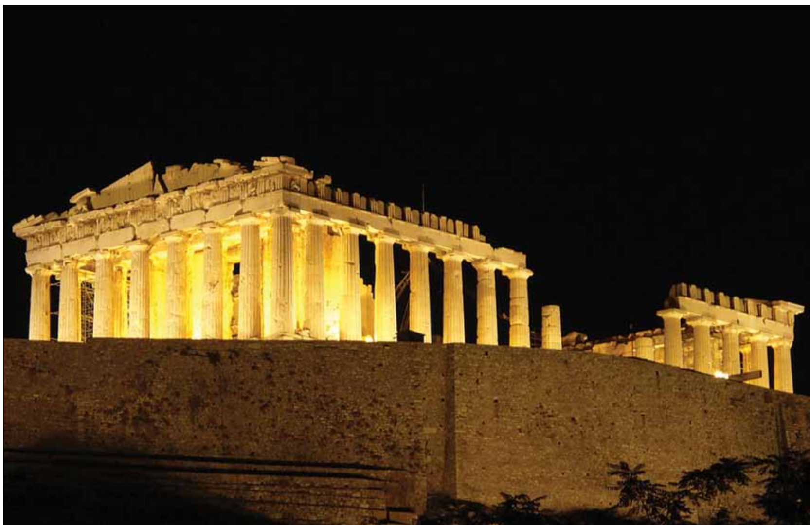
§ Ακρόπολη, 1987 (κριτήρια I,II,III)