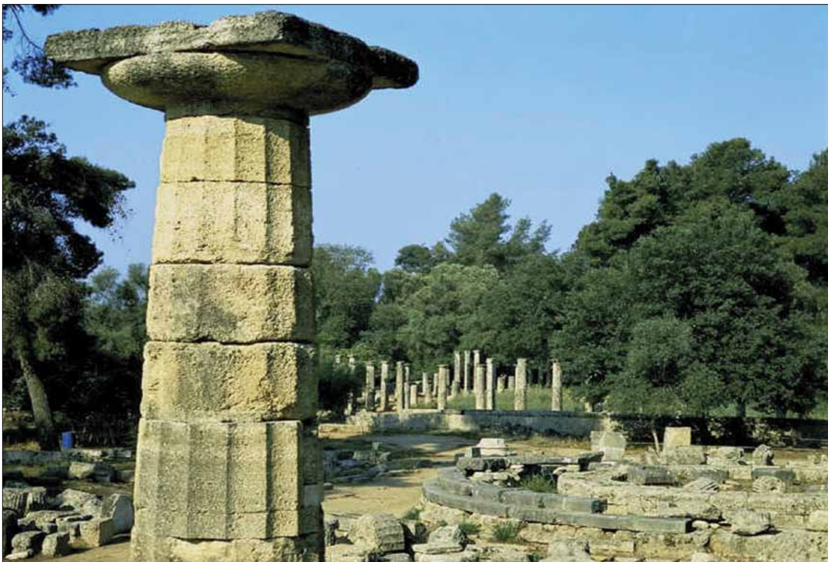
§ Αρχαιολογικός χώρος της Ολυμπίας, 1989 (κριτήρια Ι,ΙΙ,ΙΙΙ,Υ,ΥΙ)