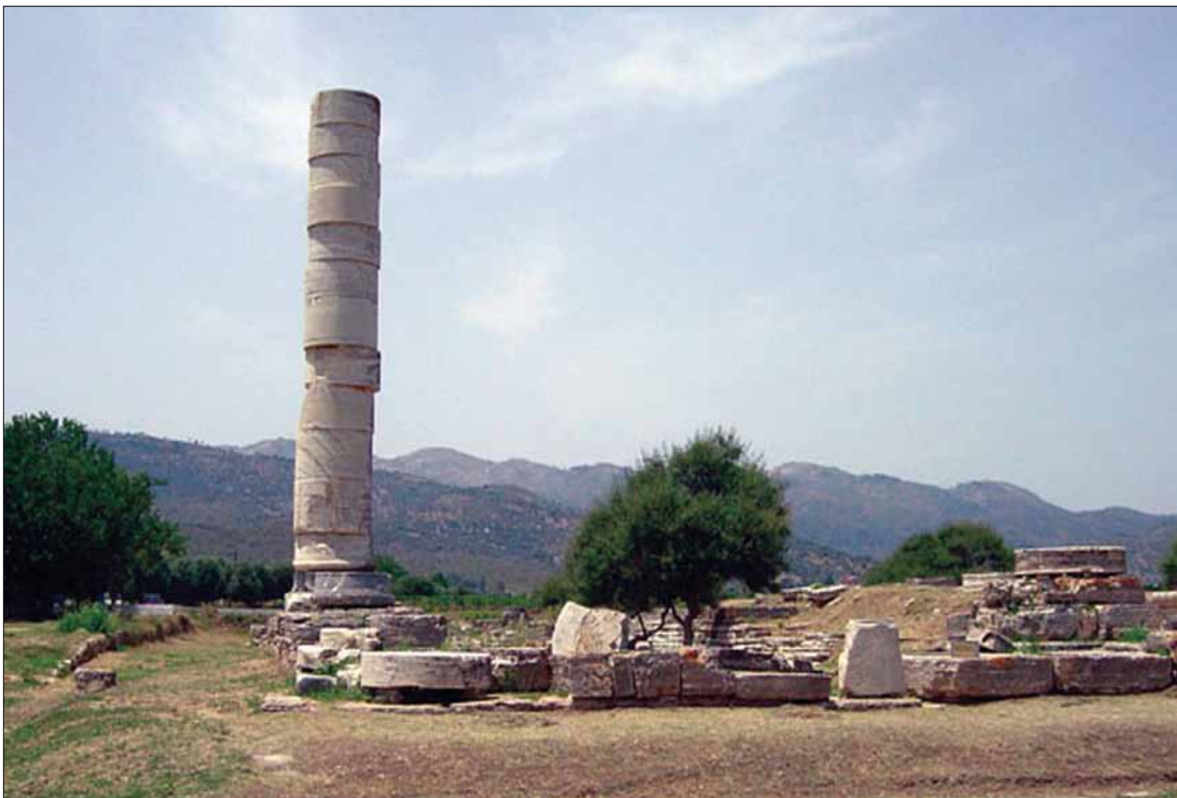
§ Πυθαγόρειο και Ηραίο Σάμου, 1992 (κριτήρια II,III)