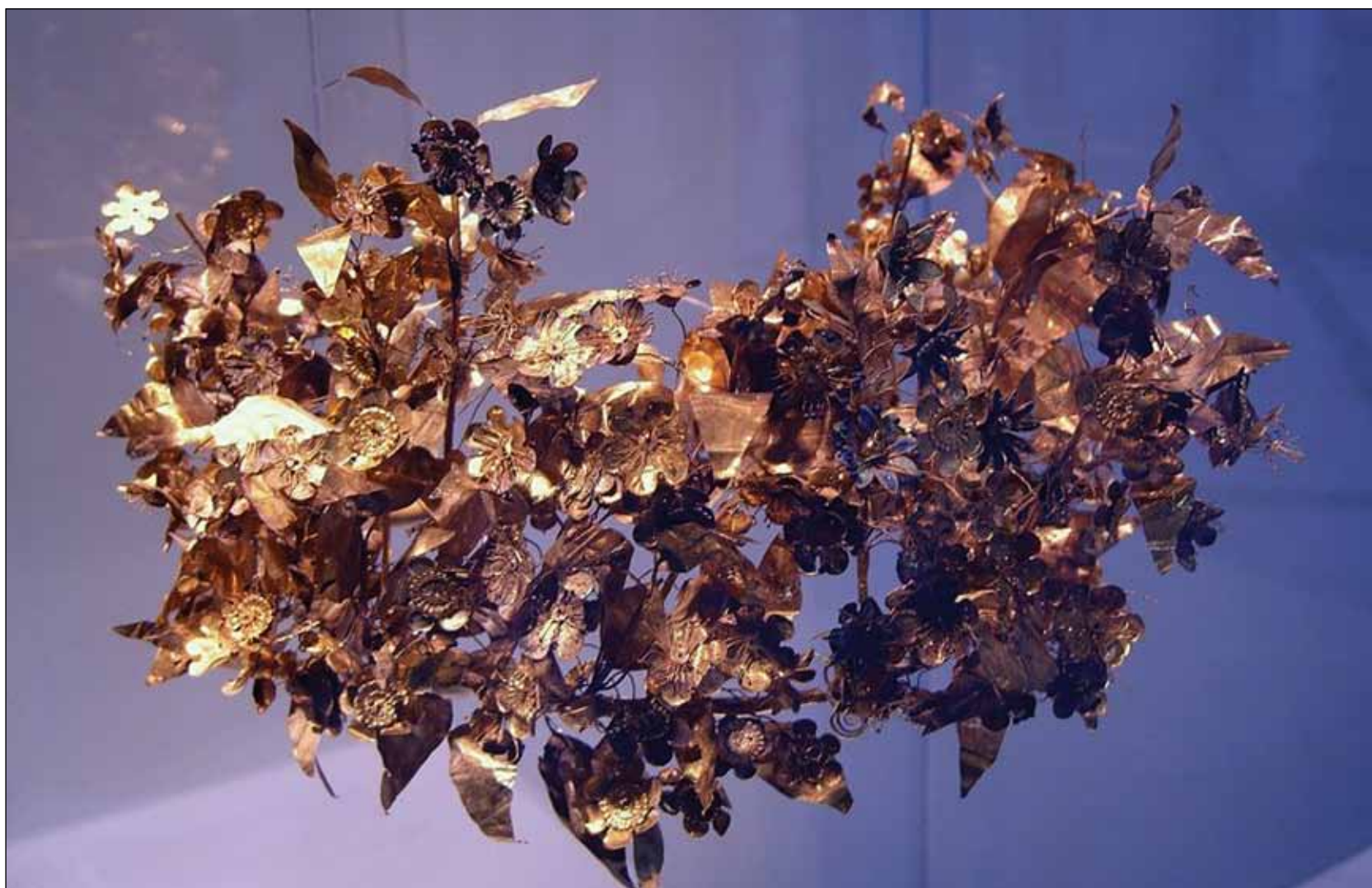
§ Βεργίνα, 1996 (κριτήρια I,III)