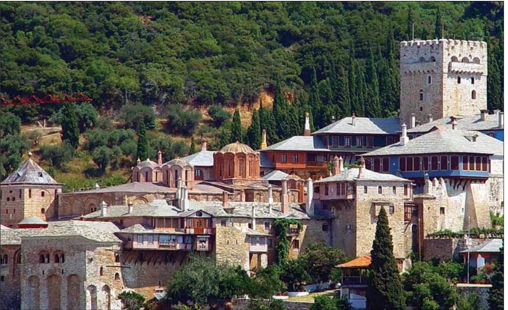
§ Όρος Αθως, 1988 (κριτήρια I,II,IV,V,VI,VII)