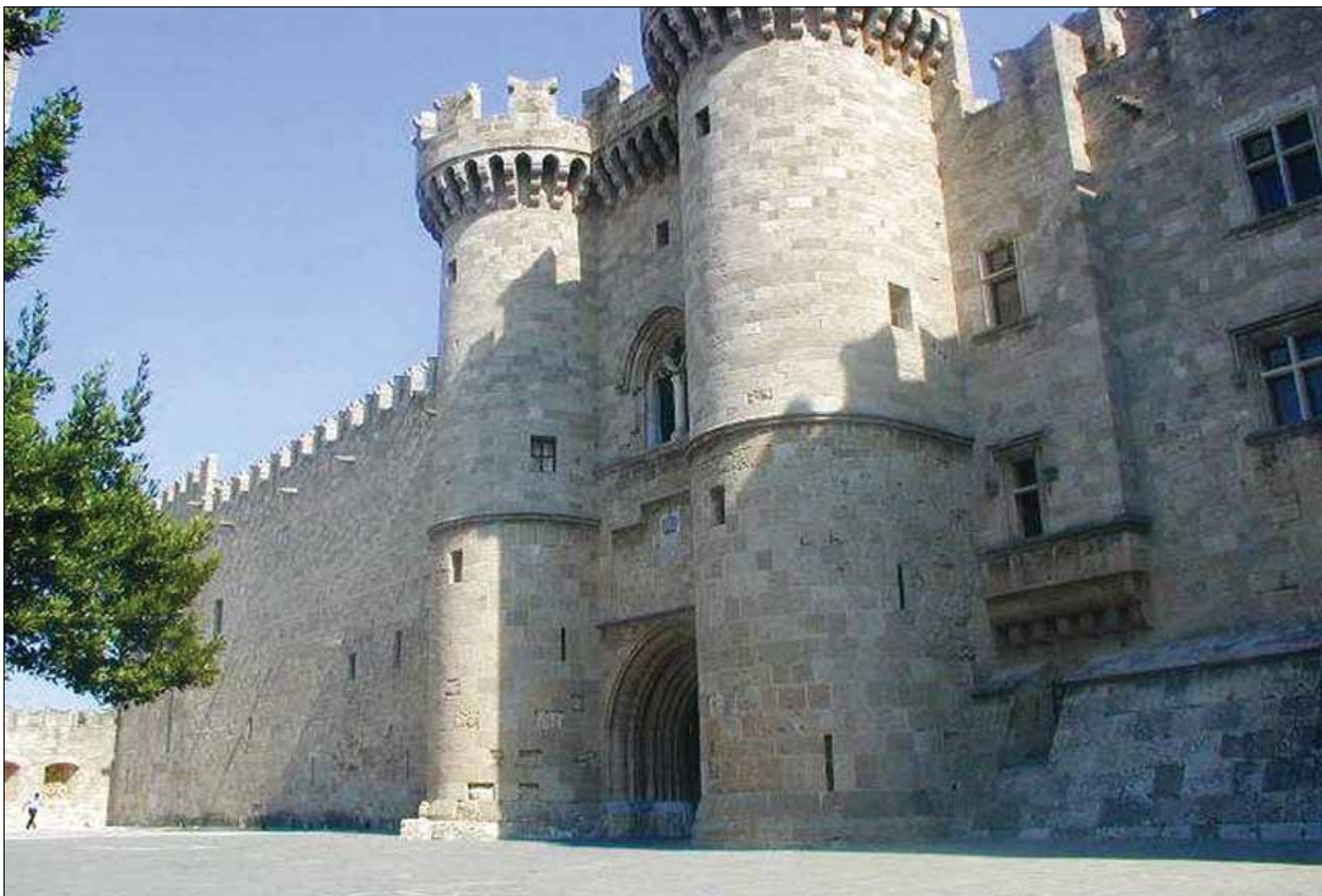
§ Μεσαιωνική πόλη της Ρόδου, 1988 (κριτήρια II,IV,V)