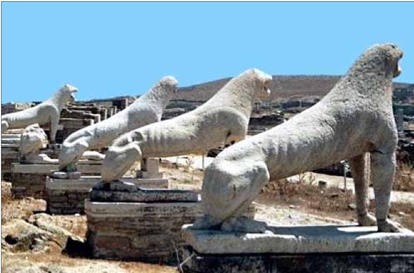
§ Δήλος, 1990 (κριτήρια II,III,IV,VI)