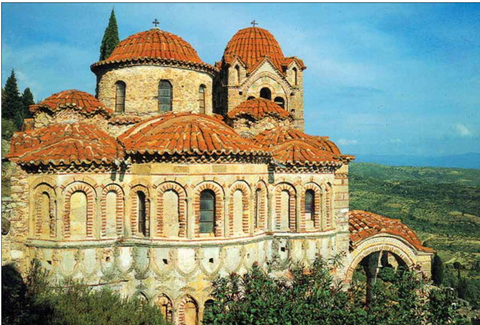
§ Μυστράς, 1989 (κριτήρια II,III,IV)